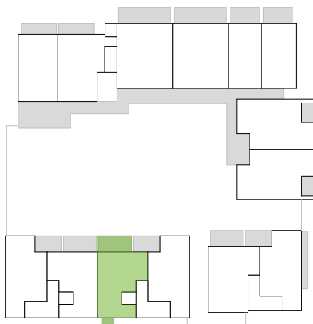
Overzichtsplan - verdieping 2